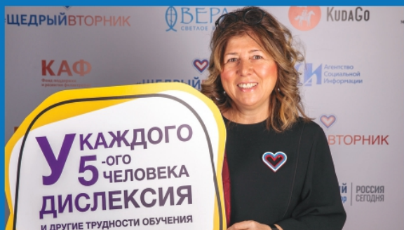
*Логотипы и шаблоны вы можете бесплатно скачать на сайте: щедрывторник.рф