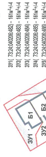
Схема блокировки земельных участков

ЗУ1 (73:24:040206:482) - 161м²+4 ЗУ2 (73:24:040206:483) - 161м²+4 ЗУ3 (73:24:040206:484) - 161м²+4 ЗУ4 (73:24:040206:485) - 161м²+4 ЗУ5 (73:24:040206:486) - 161м²+4 ЗУ6 (73:24:040206:487) - 161м²+4 ЗУ7 (73:24:040206:488) - 161м²+4