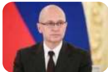
С.В. Кириенко – Первый заместитель Руководителя Администрации Президента Российской Федерации