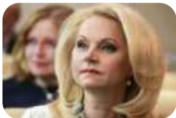
Т.А. Голикова – Заместитель Председателя Правительства Российской Федерации