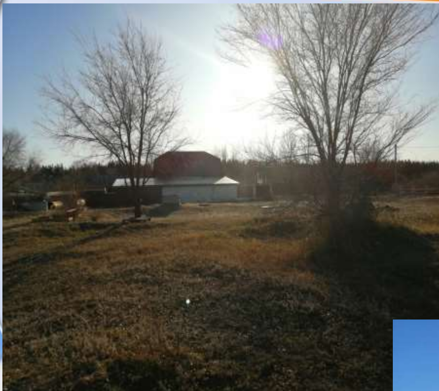
ФОТО ЧТО БЫЛО